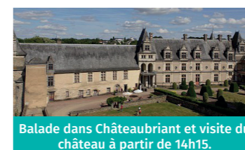
Balade dans Châteaubriant et visite du château à partir de 14h15.

SORTIE JOURNÉE À CHÂTEAUBRIANT : visite du château et de la résidence seigneuriale