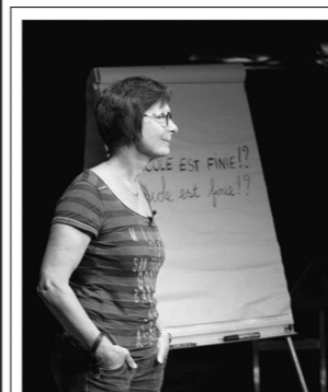
L'école est elle vraiment finie ? Et si l'on disait « Non ! ».....

Toute petite, je suis tombée dans « une cour » d'école comme Obélix dans la marmite et n'ai jamais quitté l'école. J'y ai grandi, j'ai enseigné 37 ans en maternelle, je suis devenue directrice. Et j'ai vu des gros mots pénétrer cet univers auquel je suis profondément attachée : compétences, évaluations, résultats, performance... L'école serait-elle pensée comme n'importe quel type d'organisation productive ? L'école deviendrait-elle indifférente aux différences ? L'école joue-t-elle encore son rôle d'émancipation par les connaissances et les savoirs, ou formate-t-elle des salariés flexibles et adaptables à souhait pour le monde professionnel ? Verrai-je bientôt sur le fronton de l'école de la République, héritage de mes parents, les mots « Liberté, égalité, fraternité » remplacer ceux de « Liberté, égalité, fraternité » ?